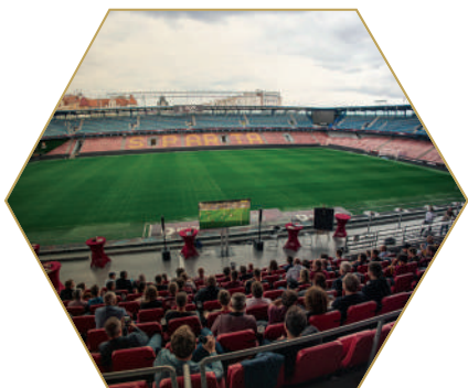
Sledování 1. kola nadstavby F:L květen 2024