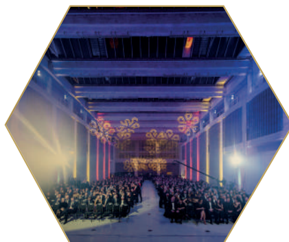
GALAVEČER 130 let listopad 2023