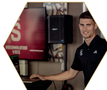
Fotbal a data duben 2024