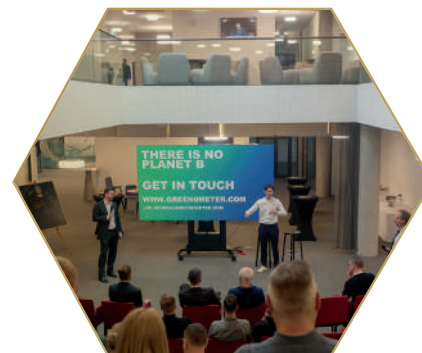
Fotbal, Business a síla udržitelosti únor 2024