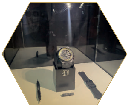
Sparta a čas říjen 2023