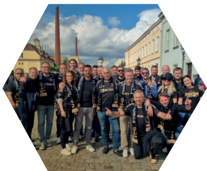
Výjezd do Plzně na finále MOL Cupu květen 2024