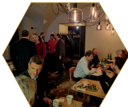
Procházka vánoční Prahou se společným sledováním domácího utkání ve VIP prostorách prosinec 2023